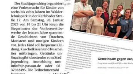
Der Stadtjugendring organisiert eine Vorlesenacht für Kinder von sechs bis zehn Jahren im Walderlebnispark in der Karlsbadstraße 17. Am Samstag, 28. Januar 2023 von 18 bis 21 Uhr lesen die Siegerinnen der Vorlesewettbewerbe der letzten Jahre spannende Geschichten von Drachen, Monstern und mutigen Kindern vor. Jedes Kind soll bequeme Kleidung, Kuschelecken und Kuscheltier mitbringen. Getränke und Snacks gibt's kostenlos vom Stadtjugendring. Anmeldung unter info@sjr-passau.de oder 08 37932495. Die Teilnehmerzahl begrenzt.