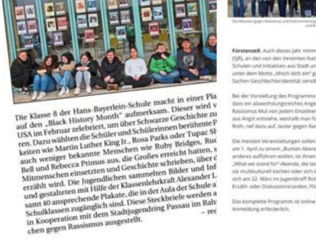
Die Klasse 8 der Hans-Bayerlein-Schule macht in einer PIA auf den „Black History Month“ aufmerksam. Dieser wird von Februar bis April gefeiert, um die Geschichte der Schwarzen in den USA zu feiern. Die Schüler haben eine Ausstellung über die Geschichte der Schwarzen in den USA erstellt. Die Ausstellung zeigt die Lebensgeschichte von Rosa Parks und Martin Luther King Jr. sowie die Rolle der Schwarzen in der amerikanischen Geschichte. Die Ausstellung ist bis zum 31. März im Schulmuseum ausgestellt.