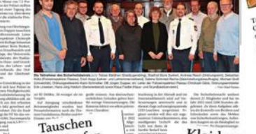
Am Mittwoch, 18. Januar, veranstaltet der Stadtjugendring ein Kleidertausch im Zeughaus. Im Rahmen der Pride Week werden alle Kleidungsstücke kostenlos getauscht. Die Veranstaltung findet im Zeughaus statt und ist für alle Interessierten kostenlos.