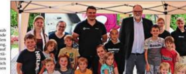
Ziel des Spielmobils ist, die Kreativität der Kinder anzuregen und ihre Fantasie und Spieltrieb zu aktivieren. Das Spielmobil ist kein Ferienprogramm, sondern hat einen anderen Charakter, bei dem die Kinder selber entscheiden, ob sie mitmachen und wann sie kommen und gehen wollen. Die Teilnahme ist kostenlos, Anmeldung ist nicht erforderlich. Bei Regenwetter fällt der Spielbetrieb aus.